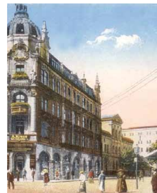
Ulica Młyńska; na pierwszym planie kamienica narożna przy ul. Młyńskiej 2; dalej — gmach Katolickiej Szkoły Ludowej (dziś znajduje się tu budynek UM); w oddali obiekty młyńska parowego. Pocztówka z początku XX w.