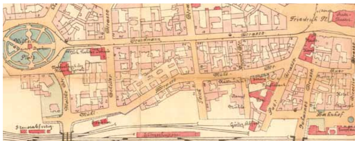
Ulica Młyńska jako Mühlstrasse na planie miasta z 1905 r.

Mapy z połowy XVIII wieku wskazują na istnienie traktu ze wsi Katowice do Załęskiej Hałdy i Ligoty, biegnącego śladem dzisiejszych ulic Młyńskiej i Mikołowskiej. Początkowo obecna ul. Młyńska była wiejską ścieżką, a następnie jednym ze szlaków prowadzących z Katowic w kierunku południowo-zachodnim. Chałupy chłopskie koncentrowały się w początkowym biegu drogi, w centrum wsi. W XIX wieku wznoszono przy niej młyny parowe (Dampf-mühl). Budowano je tu ze względu na bliskość rzeki Roździanka, później nazywanej Rawą. Obok młynów powstawały także specjalne magazyny na zboże. Fasady budynków tak zaprojektowano, aby przypominały mieszczańskie kamienice. 15 marca 1856 roku przeniesiono na ul. Młyńską (obecnie nr 4, w miejscu, w którym dziś funkcjonuje Urząd Miasta) szkołę ludową z ul. Pocztowej. Była to pierwsza szkoła w Katowicach, działająca od 1827 roku.