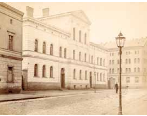
Gmach Katolickiej Szkoły Ludowej ok. 1870 r.

ślano marcepanowym dworem). Obiekty pod numerami 22 i 23 zajmowały instytucje niemieckie — redakcja czasopisma „Der Aubruch” i Niemiecki Związek Gospodarczy, a w latach 30. organizacje prohitlerowskie. Budynki młynów istniały nadal, jednak nie pełniły już swojej funkcji — zaadaptowano je m.in. na pomieszczenia mieszkalne.