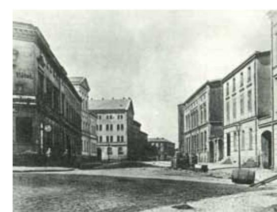
Ulica Młyńska ok. 1870 r.; pierwszy po lewej to nieistniejący obiekt hotelu Kotzura.