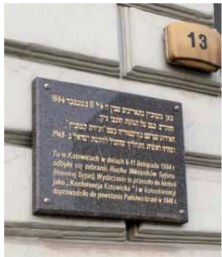
Tablica pamiątkowa na fasadzie budynku przy ul. Młyńskiej 13.