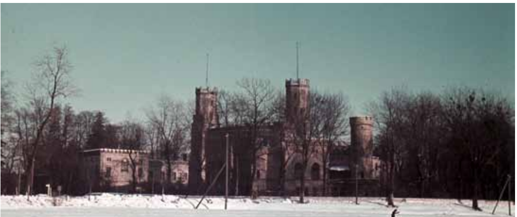
Widok ogólny świerklanieckiego zamku, zdjęcie sprzed 1945 roku.