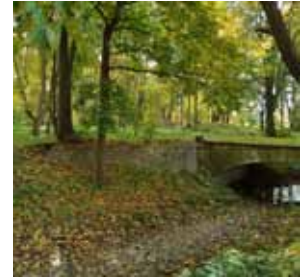
Mostek na zamkową fosę, przez który wiodła alejka łącząca zamek z pałacem.

Na widoku można wyróżnić dwie wieże, z których jedna narysowana jest mniej więcej w osi środkowego szczytu. Przy takim spojrzeniu na zamek szczyt południowy należał do kamiennego domu, stanowiącego najstarszą część zamku, środkowy znajdował się nad budynkiem bramy prowadzącej na wewnętrzny dziedziniec. Wieża przy tym szczytce