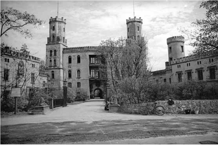
Zamek po przebudowie na styl gotyku angielskiego. (zdj. pochodzi z NAC syg. 3_131_0-_176_27272925)

Koźła (rozbudowanie podzámce o charakterze gospodarczym). Zazwyczaj zagospodarowanie terenów nie zmieniło się przez wieki. Dziewiętnastowieczne budynki folwarczne zamku świerklanieckiego zachowały się do dziś i można przypuszczać, że w pierwszej połowie XVI wieku folwark znajdował się w tym samym miejscu lub w pobliżu.