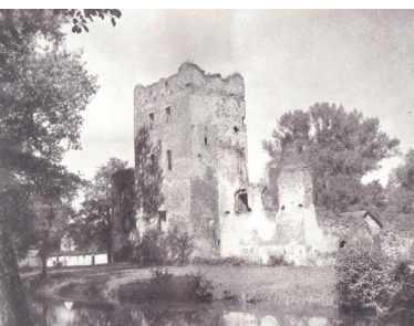
Ruiny zamku w Chudowie od strony południowo-wschodniej, ok. 1910 r.

Plan ruin zamkowych z 1928 roku z zaznaczonymi sklepieniami wg D. Adamska-Heś, R. Heś, R. Szoltysek Dzieje zamku w Chudowie