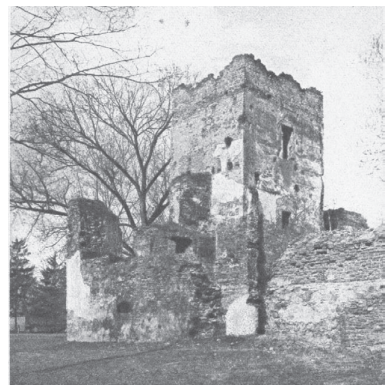
Ruiny zamku od północno-wschodu, lata 20-te XX wieku

Data śmierci Jana Gierałtowskiego nie jest znana, ale w styczniu 1572 roku jako następcą wzmiankowany jest jego syn, najstarszy z rodzeństwa - Wacław starszy Gierałtowski. W 1570 roku wymieniony został jako darczyńca szpitala w Bytomiu, co może wskazywać, że już był panem na Chudowie, skoro było go stać wyłożyć kwotę 100 talarów. Pełnił on funkcję sędziego ziemskiego państwa bytomskiego. Z tą funkcją wymieniony został jeszcze w dokumentach w 1580 roku, 1583 roku, a ostatni raz w 1585 roku. W 1587 roku zapisał w testamencie żonie Agnieszce z Rogoyskich Gierałtowiec, pół Przyszowic i Knurowa, która zo-