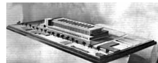
Makieta hali targowej, jaką pierwotnie zaprojektowano, a której budowie przeszkodził kryzys gospodarczy.

Wnętrze hali targowej jeszcze przed urządzeniem w niej stoisk handlowych. Wyraźnie widać, że dla kramów wydzielono miejsce, pomiędzy którymi powstawały małe alejki.