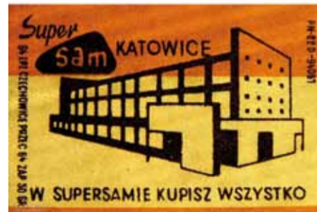
Hala targowa tuż przed otwarciem.

Gratka dla filumenistów, czyli marketing siemiężnych lat PRL-u. Tak naprawdę nie wiemy czy etykieta zapakczana miała przysporzyć klientom Supersamowi, czy też Supersam był sponsorem zakładów zapakczarskich.